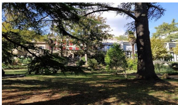
Le Bartèu

Nous vous donnons rendez-vous au Bartèu le samedi 15 juillet !