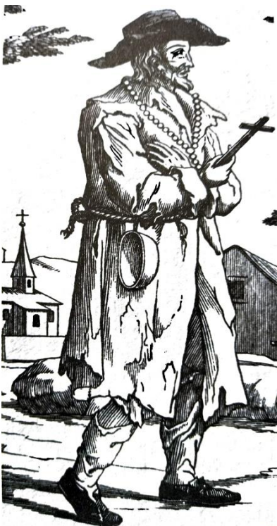
Saint Benoît Labre

Au-delà du pain et du vêtement, n'était-ce pas aussi la faim d'amour, la soif de dignité et le besoin d'un peu de chaleur humaine et de consolation que mendiaient ces malheureux, et que leur prodiguait en abondance l'infatigable apôtre ?