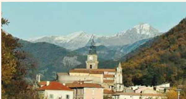
→ La Cathédrale Saint Jérôme à Digne

Malgré la distance du temps, le témoignage de Mgr de Miollis continue aujourd'hui de nous inspirer. Si sa charité, sa douceur et son humilité nous touchent, c'est qu'elles nous ramènent à l'essence du message évangélique et du rôle de l'évêque, successeur des Apôtres. Le récit de sa vie a fourni une riche matière aux historiens et aux romanciers, mais il fait bien mieux : il ouvre à chacun de nous un chemin de sainteté.